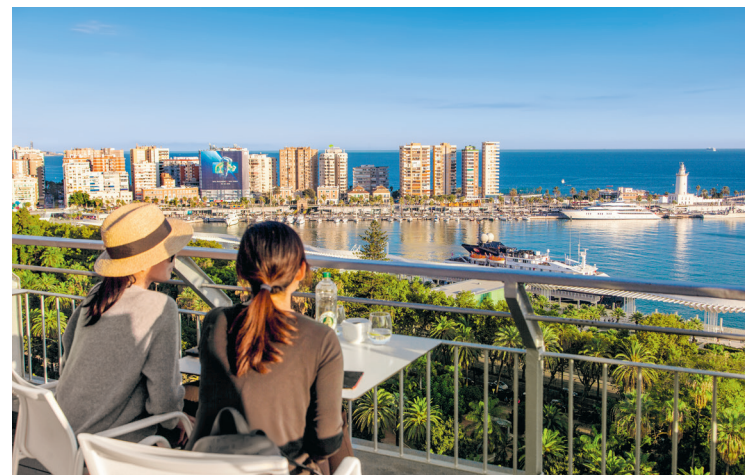
Een panorama tot aan de horizon; vanaf het kasteel van Málaga of een roofteropbar in de buurt van de haven is het uitzicht geweldig

In de voetgangersvriendelijke oude stad kun je de pracht van de stedelijke fin-de-sièclearchitectuur ten volle ervaren. Kenmerken zijn de glazen, gesloten balkons met sierlijke houten kozijnen of ijzeren smeedwerk uit de late 19e of