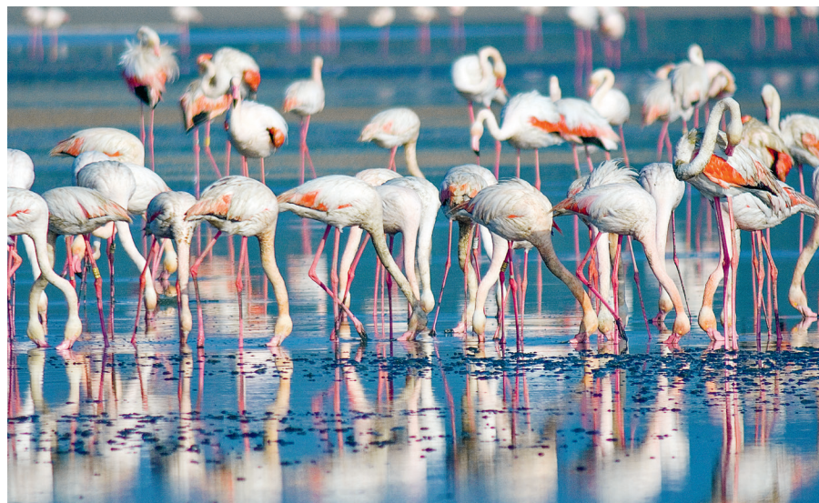
Natuurlijke wetlands zoals de Fuente de Piedra bij Antequera krijgen in het waterarme land speciale bescherming. De lagune is een broedplaats voor een grote kolonie roze flamingo's

Door het gebrek aan opleidings- en economisch perspectief trekken de mensen naar de steden en kust, waar de betonmolens de afgelopen decennia niet hebben stilgestaan. In 2022 woonde ruim 11% van de Andalusiërs nog in een landelijke omgeving (gemiddeld in